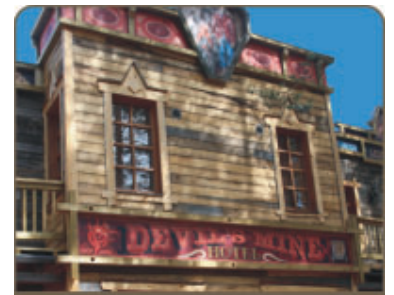
Devil's Mine Hotel